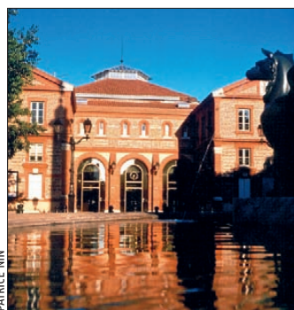
La Halle aux Grains de Toulouse.