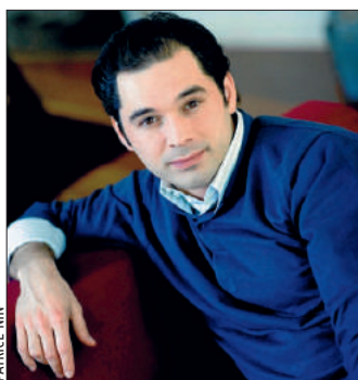
Le jeune chef russe Tugan Sokhiev.