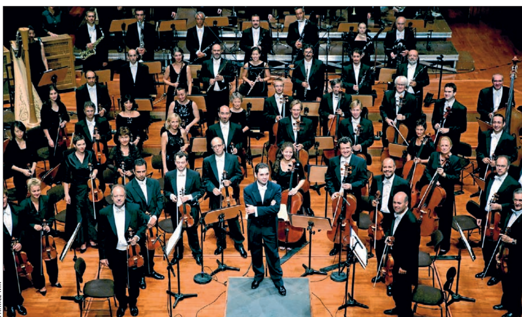
L'orchestre national du Capitole de Toulouse sous la baguette de Tugan Sokhiev.