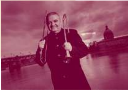
DANIEL LASSALLE sacqueboute

Daniel Lassalle a acquis une réputation internationale de premier plan, à la fois comme tromboniste et comme joueur de sacqueboute, deux instruments qu'il pratique avec une virtuosité et une musicalité rares.